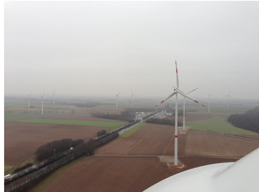
Perwez, le long de la E411